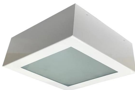
Figura 01 – Luminária Tipo Plafon Quadrado com Duas Lâmpadas de LED 10W.