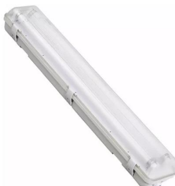
Figura 04 – Luminária Hermética Tubular com Duas Lâmpadas de LED 1,2m de 18W.

TODA E QUALQUER TROCA DE SERVIÇO SÓ PODERÁ SER EFETUADA COM O CONSENTIMENTO DO ENGENHEIRO FISCAL E DEVIDAMENTE REGISTRADA NO DIÁRIO DE OBRAS. SOB PENA DA NÃO ACEITAÇÃO DO SERVIÇO.