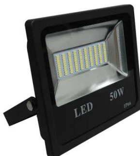
Figura 03 – Refletor de LED 50W